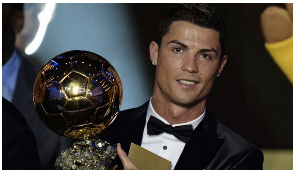
Star du Real de Madrid, le Portugais Cristiano Ronaldo est l'un des rares joueurs étrangers jouant en Espagne.